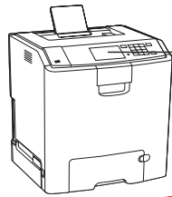
Pantalla táctil de 4,3 pulgadas (10,9 cm)